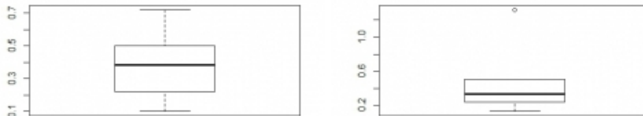
Obr. 2: Dopad zníženia netarifných prekážok medzi EÚ a USA v ambicióznom scenári TTIP na HDP EÚ (vľavo) a USA (vpravo) pri použití CGE modelov.

Na vyhodnotenie možného vplyvu TTIP bolo využitých niekoľko rôznych metodologických postupov. Najčastejšie použitý je takzvaný "computable general equilibrium" (CGE) model od Francois et al. (2005) vytvorený pre "global trade analysis project" (GTAP). Najnovšia verzia GTAP obsahuje hospodárske údaje pre 114 krajín a 20 agregovaných regiónov, aktualizovaných do roku 2007, ktoré sú využiteľné pre prognózu dlhodobého vplyvu (v horizonte desiatich rokov) zmien obchodných politík. Na základe odhadov prekážok od ECORYS (2009) skúmajú vplyv TTIP v prípade ambiciózneho scenára (zredukovanie netarifných prekážok o polovicu) a konzervatívneho scenára (zredukovanie netarifných prekážok o 25%). Francois et al. (2013) rozširuje analýzu, ktorú